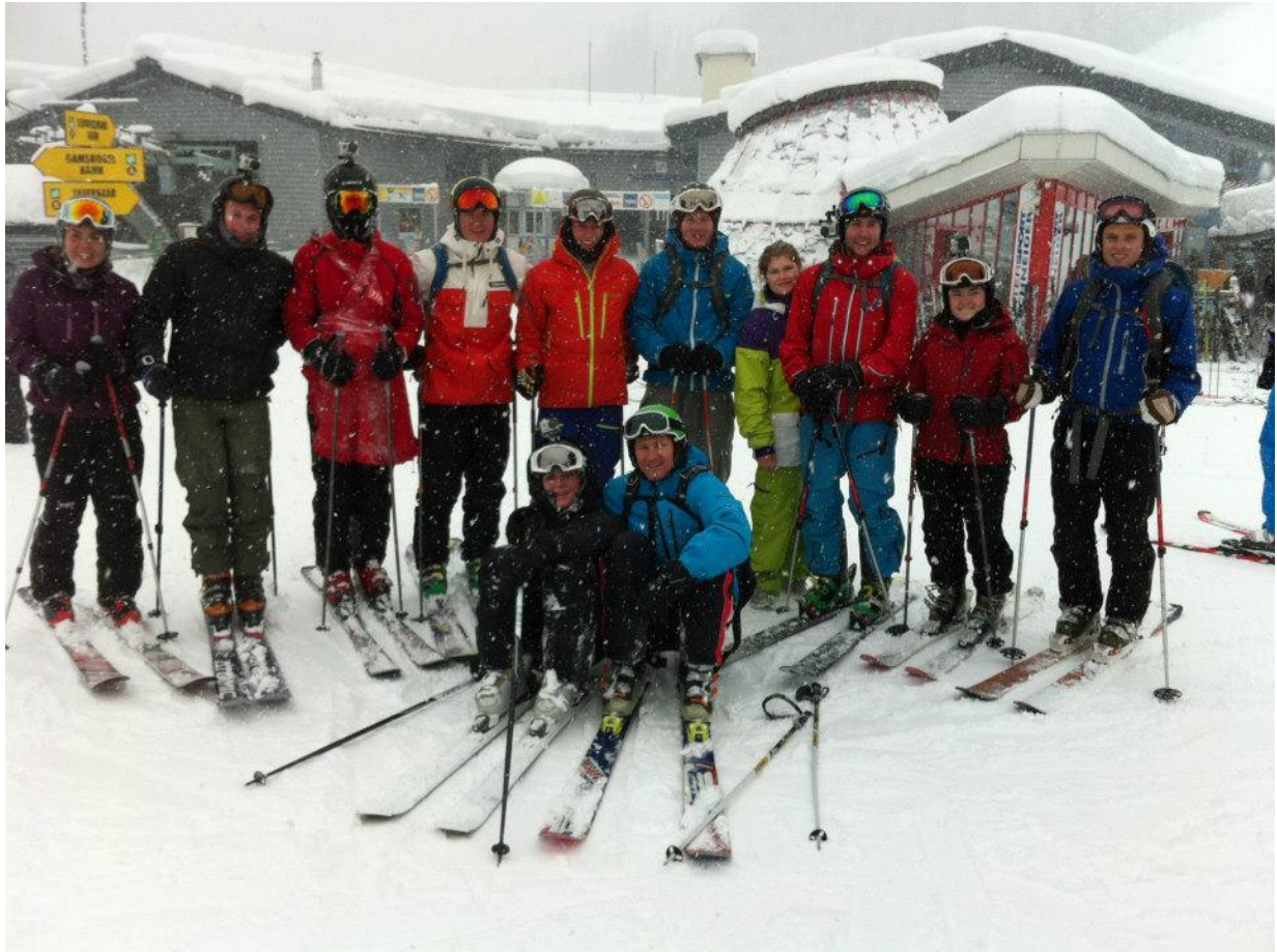
Skigruppa mi i Østerrike. Gut som står nr. 3 frå venstre har på seg "tabbeforkledet", som kvar dag vart gitt til den som tabba seg ut mest.

Første dagen hadde vi frikjøring og kunne boltre oss fritt i dei utallege løypene. Neste dag vart vi delt inn i grupper etter ferdigheitsnivå. Instruktøren vi fekk på gruppa mi hadde massevis av erfaring og visste godt kvar vi skulle køyre for å finne dei beste forholda. I tillegg til å vere eit råskinn på ski hadde han også ei fortid som toppidrettsutøvar i både sjukamp og boksing, så han var med andre ord svært atletisk.