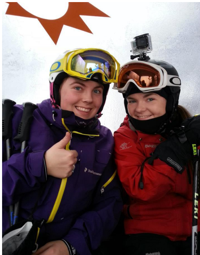
Med så mykje puddersnø var i alle fall smilet på plass! GoPro-kameraet på hovudet filma mange fine augeblikk.

I området rundt der vi budde var det mange skianlegg, så dei neste dagane tok vi turen til både Reiteralp og Zauchensee for å finne dei beste forholda. Personleg var Zauchensee min favoritt, sidan denne plassen var eit ekte pudderparadis og serverte oss ein heil meter djup puddersnø. Heilt rått!