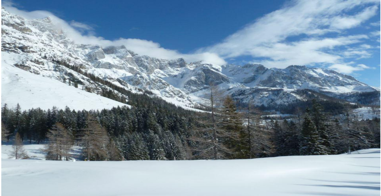
Majestetiske fjell på topptur. Heilt fantastisk!

I området rundt der vi budde var det mange skianlegg, så dei neste dagane tok vi turen til både Reiteralp og Zauchensee for å finne dei beste forholda. Personleg var Zauchensee min favoritt, sidan denne plassen var eit ekte pudderparadis og serverte oss ein heil meter djup puddersnø. Heilt rått!