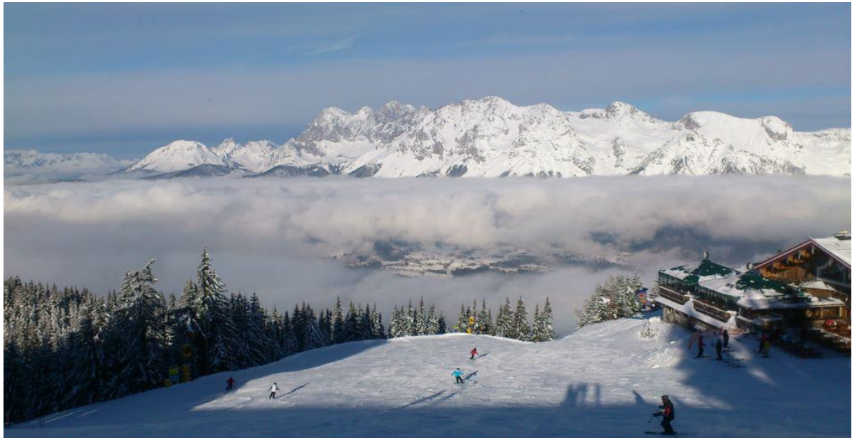
Nydelege forhold i skianlegget i Schladming!

Neste dag valde eg å vere med på ein topptur i det nydelege alpelandskapet. Vêret var fortreffeleg og eg fekk for første gong bruke randoneéskia min på ein ordentleg topptur. Kjensla av å suse ned ei fjellside i fin puddersnø etter å ha brukt fleire timar på å kave seg opp var heilt, heilt ubeskriveleg.