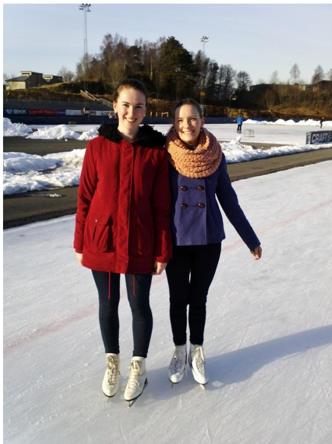
Vi fekk nesten litt påskekjensle av det fine vêret med appelsin-eting i solveggen.