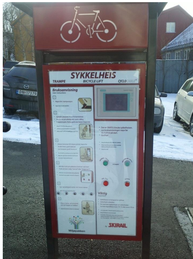
Kanskje folket her er litt late?