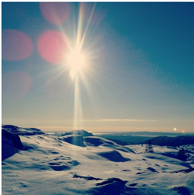
I Bergen bur eg nærme flott turterreng, og ein dag tok eg meg ein fin fjelltur. Fyrst opp trappene til Stolzeleiven – vidare til rundemanen – Fløyen – og ned fløysvingane til sentrum. Ein flott tur.